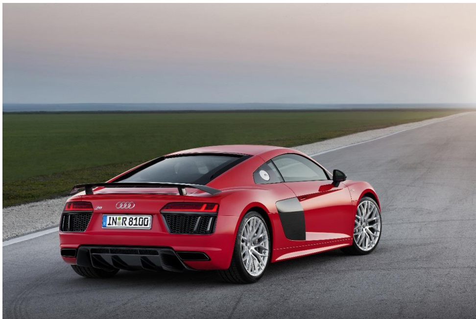
2015 - deuxième génération : Audi R8 V10 plus

Le moteur V10 doit ses caractéristiques principales au sport automobile, notamment son concept de régime élevé jusqu'à 8 700 tr/min et son système de lubrification par carter sec qui permet une installation basse. Les bancs de cylindres du moteur V10 sont installés selon un angle à 90°. Le vilebrequin, qui a été forgé comme un arbre d'équilibrage normal, alterne les intervalles d'allumage entre 54 et 90°. La séquence d'allumage des cylindres de 1 - 6 - 5 - 10 - 2 - 7 - 3 - 8 - 4 - 9 crée une pulsation unique et un son reconnaissable entre tous. Avec une vitesse maximale de 8 700 tr/min, les pistons parcourent une distance moyenne de 26,9 mètres par seconde, dépassant les chiffres de la Formule 1 d'aujourd'hui. À cette vitesse, les pistons connaissent une accélération équivalente à une charge d'environ deux tonnes aux points de renversement.