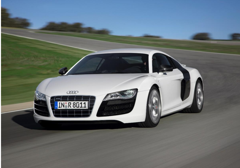
2008/2009 - première génération : Audi R8 5.2 FSI quattro

Les deux versions du moteur V10 à aspiration naturelle se sont imposées pour l'Audi R8 début 2009.