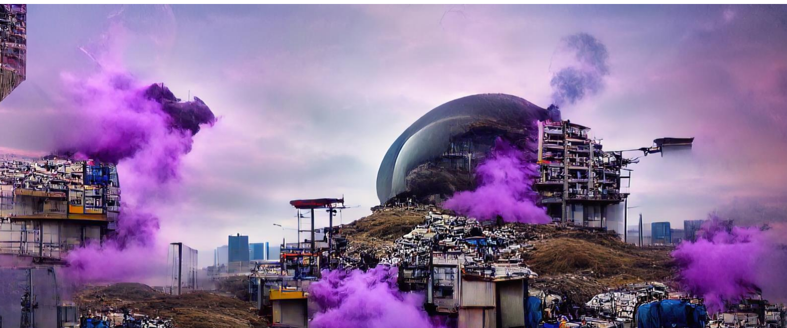
un champ d'excavation, 2018