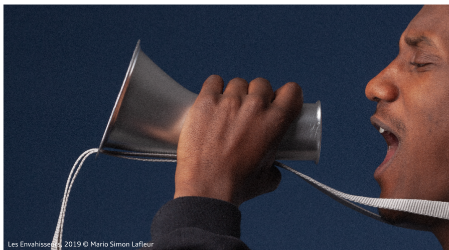
Les Envahisseurs, 2019 © Mario Simon Lafleur