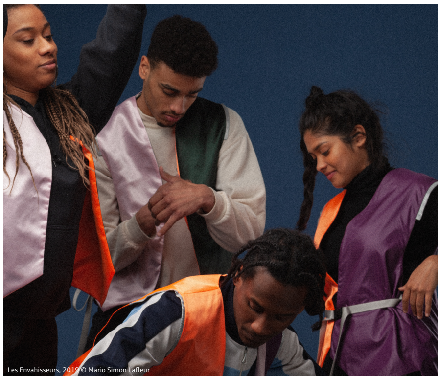
Les Envahisseurs, 2019 © Mario Simon Lafleur