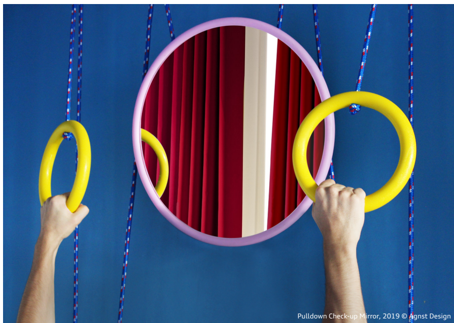
Pulldown Check-up Mirror, 2019 © Agnst Design