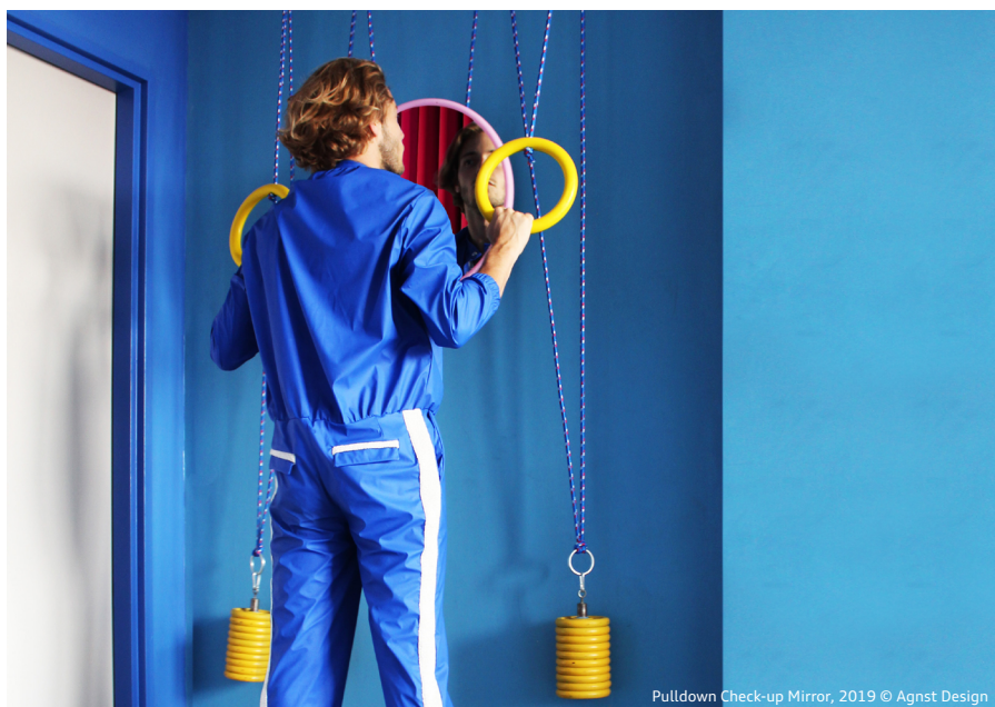
Pulldown Check-up Mirror, 2019 © Agnst Design